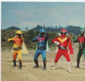
Figure 2.21 Five Rangers 秘密戦隊ゴレンジャー 1975 Tokusatsu film