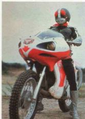
Figure 2.20 Masked Rider 仮面ライダー 1971-73 TV anime series © 1971 Toei Company Ltd. & Ishimori Pro.

森川 《エヴァ》以降、そこを起点として、今まさに流行している言葉に「セカイ系」というものがあるんです。つまり、非常に個人的な気持ちや感情がいきなり世界の命運に直結しちゃう。