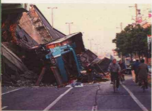
Figure 2.4 Great Hanshin Earthquake, collapsed highway in Kobe, January 1995 阪神大震災で倒壊した高速道路、神戸1995年1月

Kaichirō Morikawa: Okada-san's definition of otaku sounds positive, as if they're quite respectable.