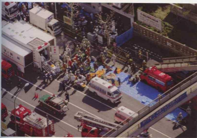
Figure 2.17 Sarin gas attack on Tokyo subway by Aum Shinrikyo, March 20, 1995 オウム真理教による地下鉄サリン事件、 1995年3月20日

岡田 じゃあ、70年代半ばから末までで、《ヤマト》と《ガンダム》と《ナウシカ》 28 があったけど、この順番でダメになっていったわけ？、それは言えな