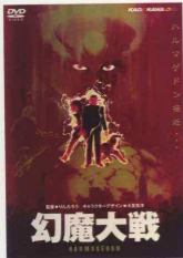
Figure 2.18 Armageddon 幻魔大戦 1983 (original film release) DVD of anime film (cover) © 1983 Kodansha Pictures, INC.

Suit Gundam . 26 Now, Morikawa-san, would you say Gundam was more unacceptable than Yamato ? I don't think so.