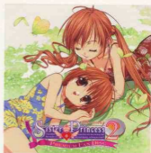
Figure 2.16 Sister Princess 2 シスター・プリンセス2 2003 PlayStation2 game ©2003 Metro-Technology, Sakuraga Kinokuni/White Works Inc., Shuei