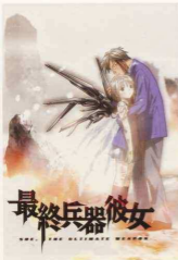
Figure 2.22 She, the Ultimate Weapon 最終兵器彼女 2002 (original TV broadcast) DVD of TV anime series (cover)

© Shin Takahashi, Singapore, Inc., The Video Company, Ltd., Teikoku Video Film Corporation, Chitose Video Broadcasting Co., Ltd.