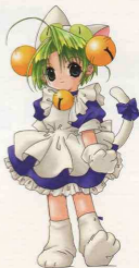
Figure 2.11 Digiko from DiGiCharaf {ア・ジ・キャラット}のてじこ © Brinscott Studio/Eggie Dorte

ただ、おたくというのは、それに耽溺しているだけで、社会性の無い連中だと。マニアを自称する人がおたくを批判するような意味合いで主に