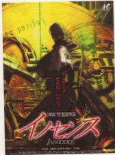
Figure 2.19 Ghost in the Shell 2: Innocence イノセンス